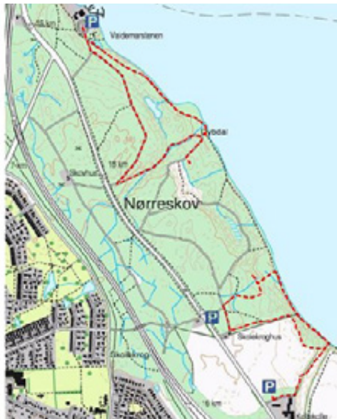
Kort over Nørreskoven.