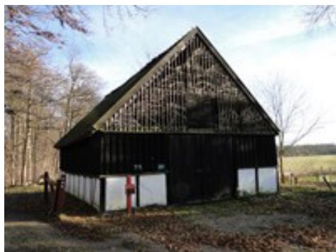
Den fredede barklade til opbevaring af egebark, der blev brugt til garvning.