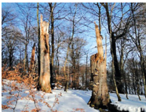
Svenskebøge i Nørreskoven.