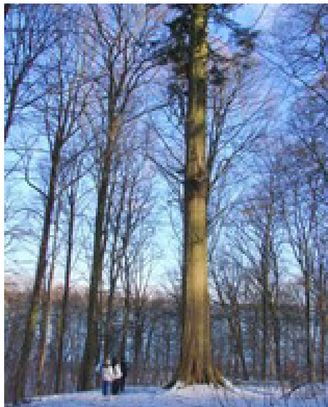
En af de sidste store ædelgraner fra von Langens tid.

- Følg stien op langs marken, der kantes af gamle ahorntræer, som den tyske forstmand von Langen plantede. Nu kommer man til den fredede Barklade fra 1800 tallet, en gammel tørrelade. Ca. 100 m henne ad grusstien mod nord drejes ind i skoven. Her passerer man gennem skov med mange gamle træer eller "ruiner" af træer fra von Langens tid. Man passerer også to 45 m høje ædelgraner, de sidste der står tilbage. Ned mod søen ses talrige store lærketræer fra samme tid. Gå ad Søstien og drej ind den slugten op langs slugten mod udgangspunktet.