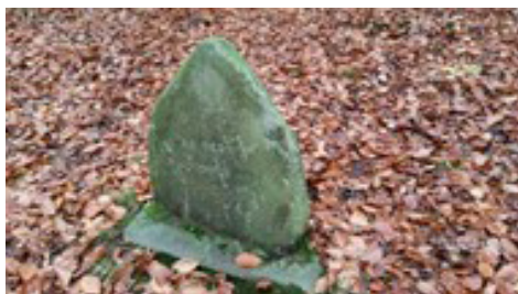
Spejderstenen, til minde om 7 spejdere, der druknede i 1940.

Søstien fører tilbage til udgangspunktet, men man kan evt. slå et smut forbi, hvor man frit kan bruge bålstedet.