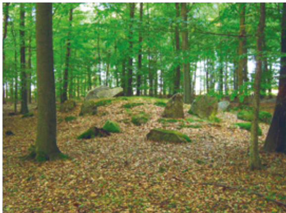
En af de stadig imponerende stendysser i Horserød Hegn

Horserød Hegn indeholder mange oldtidsminder. I den nordlige del af skoven ligger 6 mere eller mindre beskadigede langdysser fra yngre stenalder, bl.a. den